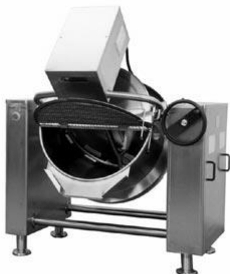
Bassine de cuisson Auriol

C'est le moyen le plus simple et le plus rapide pour la cuisson de grandes quantités d'aliments, même avec un haut degré d'acidité. Dans les versions indirectes, le système avec séparation empêche que les produits puissent rester collés au fond du récipient. En utilisant des cages appropriées on peut pasteuriser des pots de confitures et de sauces.