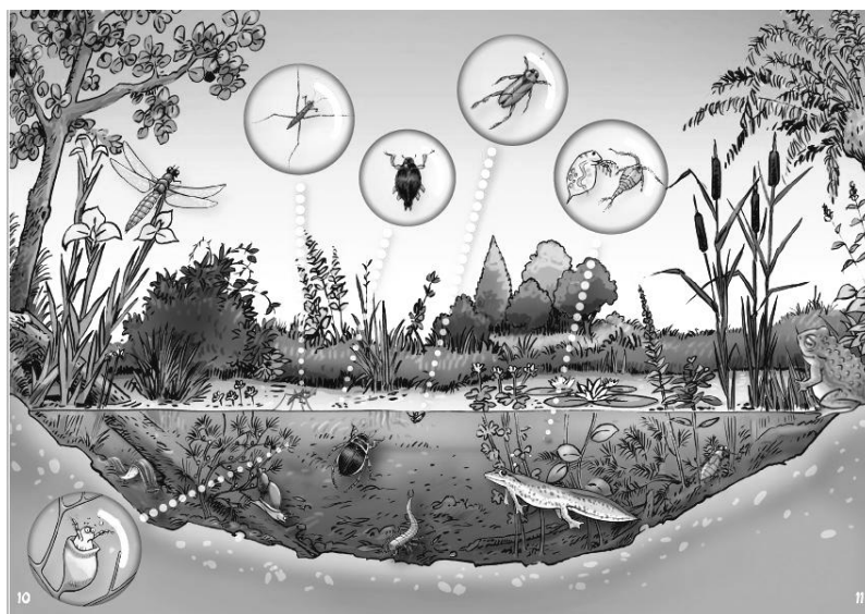
Exemple de la biodiversité dans une mare